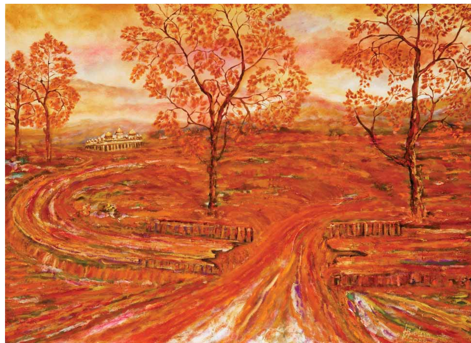
Rozbitý most v Lhoknga Acehu Olej na plátne, 80 x 100 cm