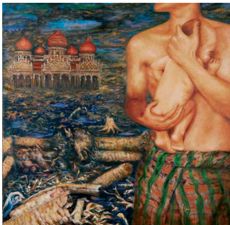
Bež, dieťaťko, bež, II Olej na plátne, 120 x 120 cm