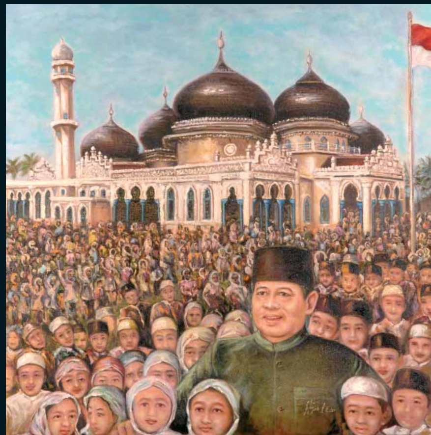
Prezident SBY obklopený sirotami Olej na plátne, 120x100 cm

Jl. Taman Widya Chandra II No.4 Jakarta Selatan INDONESIA www.dandaragallery.com Email: dandara@cbn.net.id