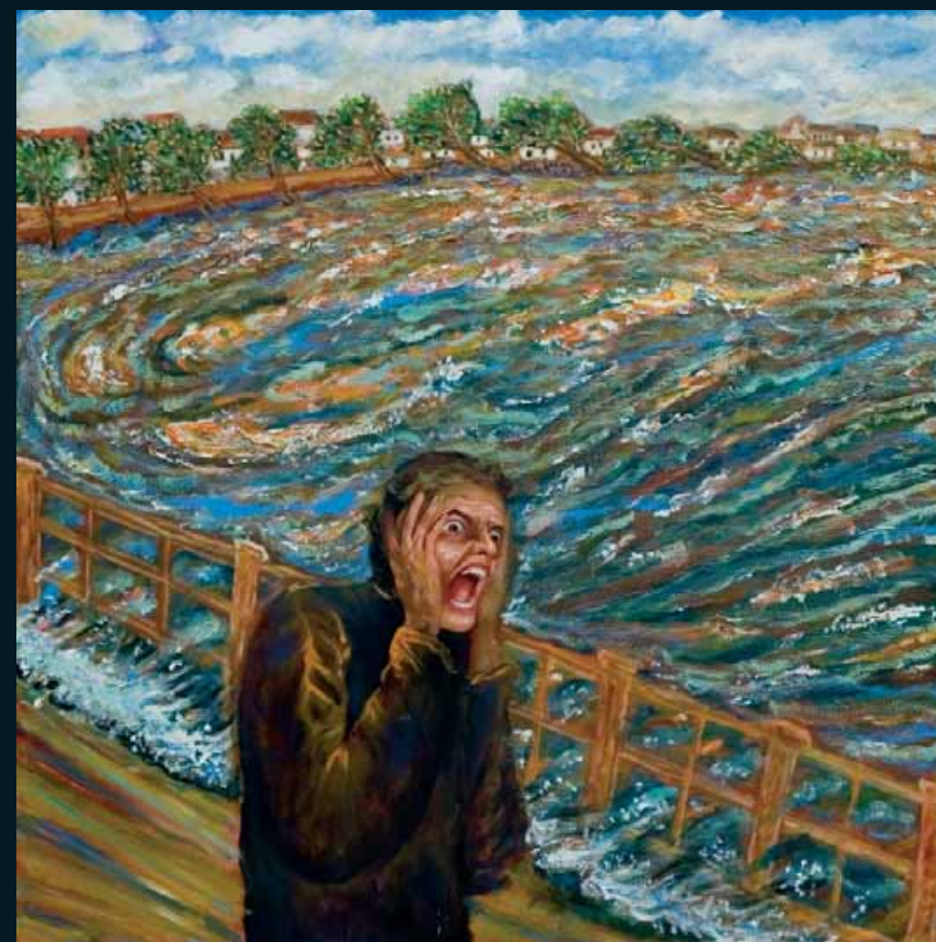
Výkrik na moste cez rieku Kreung Aceh Olej na plátne, 100 x 100 cm

Výstava obrazov Galéria MERUM, Modra Galéria BCPB, Bratislava, Slovenská republika