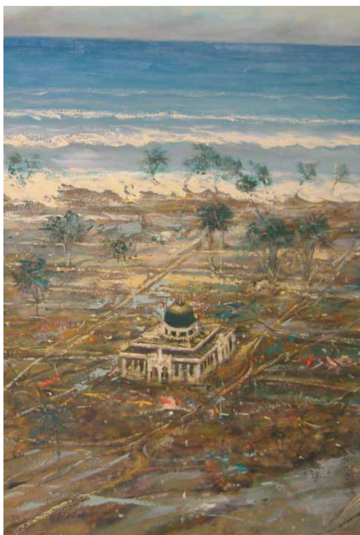
Ruiny VI Olej na plátne, 145 x 200 cm