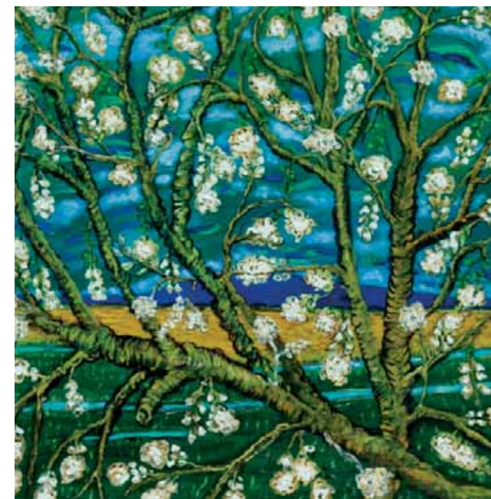
Bungong Jeumpo Olej na plátne, 100 x 100 cm