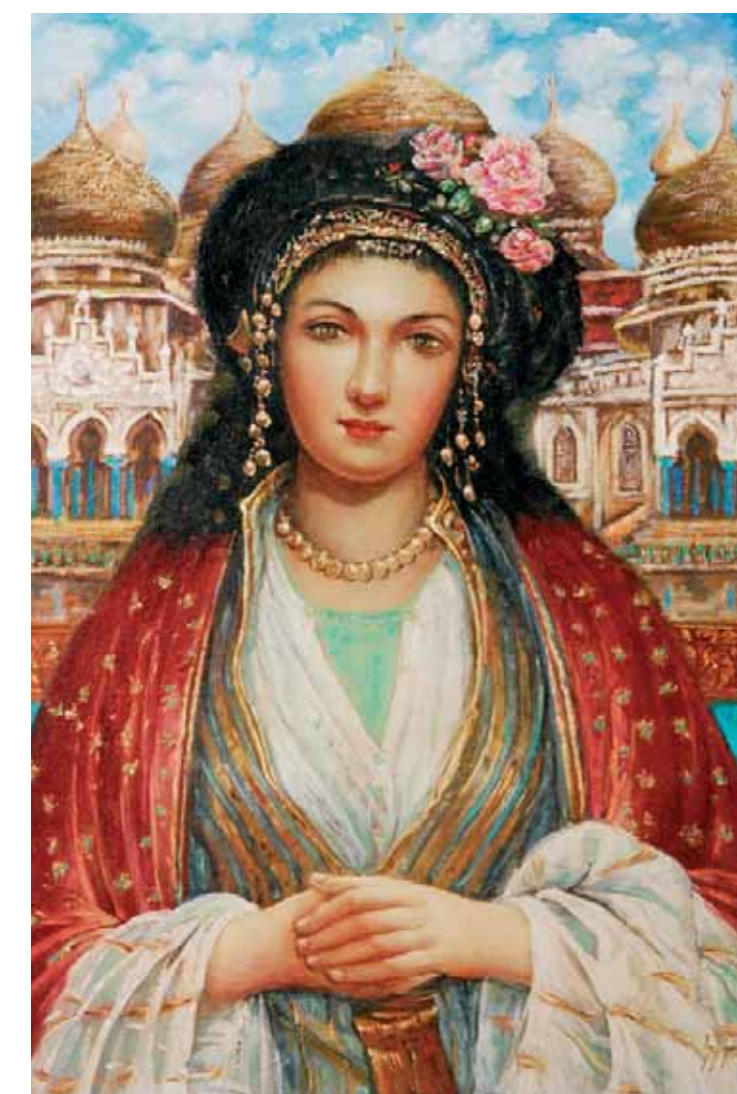
Turecká žena a mešita Baiturrahman v Acehu, Olej na plátne, 45 x 45 cm