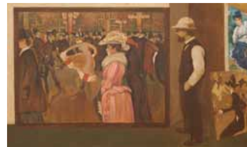
Toulouse-Lautrec, kombinovaná technika, 2014

1997 – Samostatná výstava Desastres de la guerra (Hrôzy vojny) na Veľvyslanectve Slovenskej republiky v Belehrade. Vernisáž výstavy sa uskutočnila 7. mája.