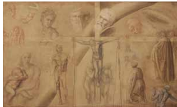
Michelangelo, kombinovaná technika, 2011

2015 – Samostatné výstavy malieb venovaných veľkým majstrom výtvarného umenia – vo Vitebskom umeleckom múzeu vo Vitebsku (1. – 31. júla) a potom aj v Minsku v Bielorusku.