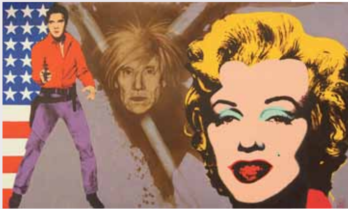
Warhol, kombinovaná technika, 2016