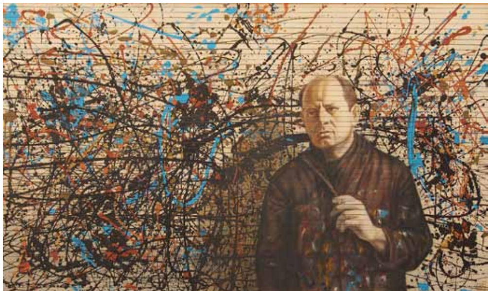
Pollock, kombinovaná technika, 2013