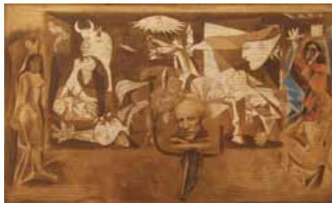
Picasso, kombinovaná technika, 2012