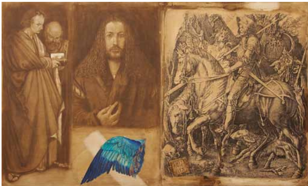
Dürer, kombinovaná technika, 2013