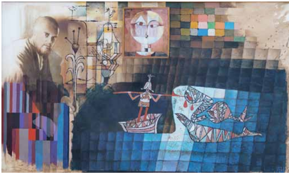
Klee, akryl na plátne, 2017