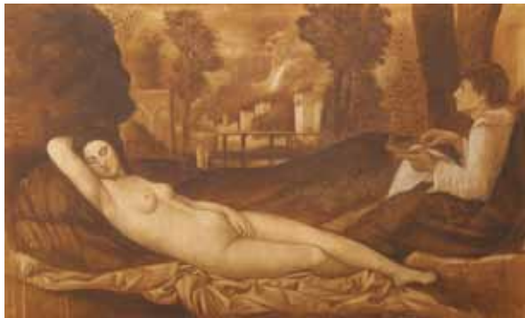
Giorgione, kombinovaná technika, 2014