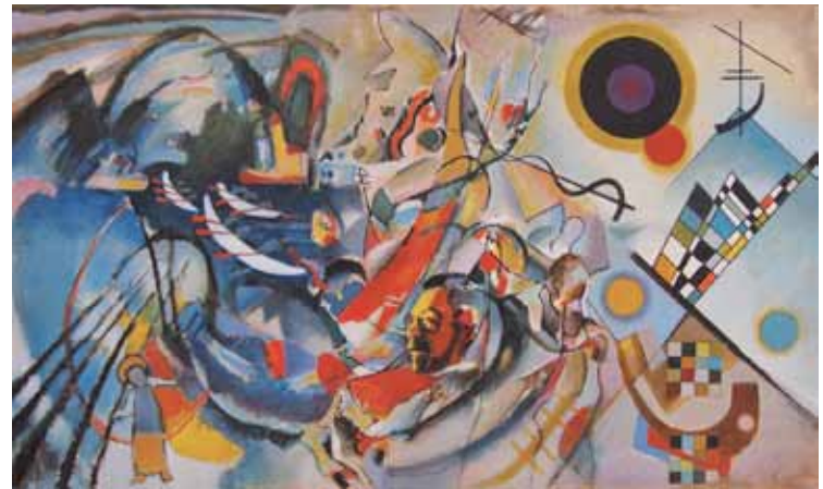
Kandinskij, kombinovaná technika, 2015

Bratislava je jedným z centier mimoriadnych a významných výstav, nielen pre Slovensko. Umenie, ktoré predstavujú jej galérie a výstavné siene má osobitú hodnotu a atmosféru. Vytvára tak unikátny priestor v strede Európy tvoriť pohľad na umeleckú hodnotu, ktorý je najmä dnes mimoriadne zložitý.