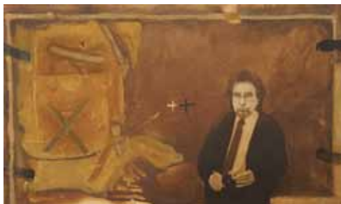
Tapies, kombinovaná technika, 2012