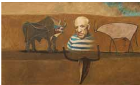
Picasso, kombinovaná technika, 2013