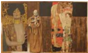
Klimt, kombinovaná technika, 2014