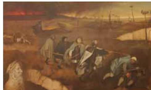
Bruegel, kombinovaná technika, 2014

2014 – V priebehu tohto roku vznikol najväčší počet malieb z cyklu venovaného popredným svetovým výtvarným umelcom.