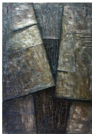
Osamelá postava olej, 1964, 65x105 cm ▲