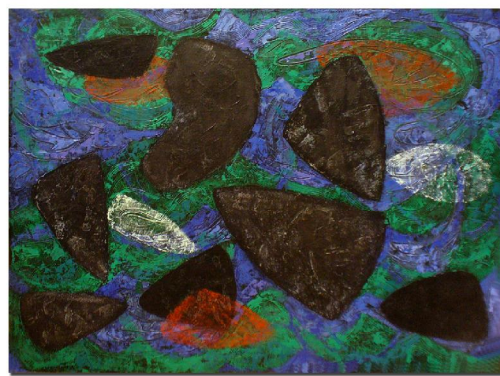
Stopy vo vode. Kamene, olej, 1962, 75x60 cm ▲