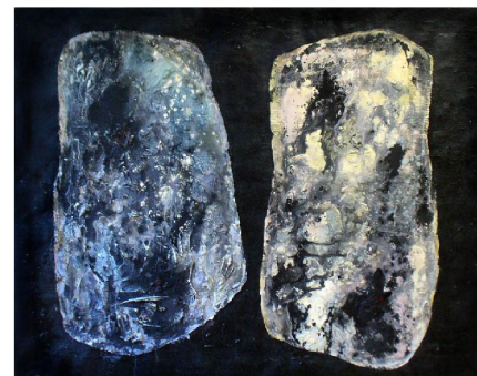
Dve torza, komb.technika, 1963, 120x80 cm ▲