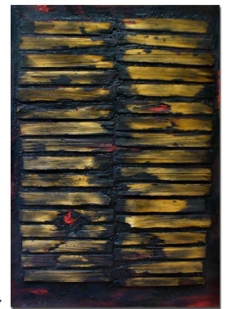
Postavy komb.technika, 1965, 105x80 cm ▶