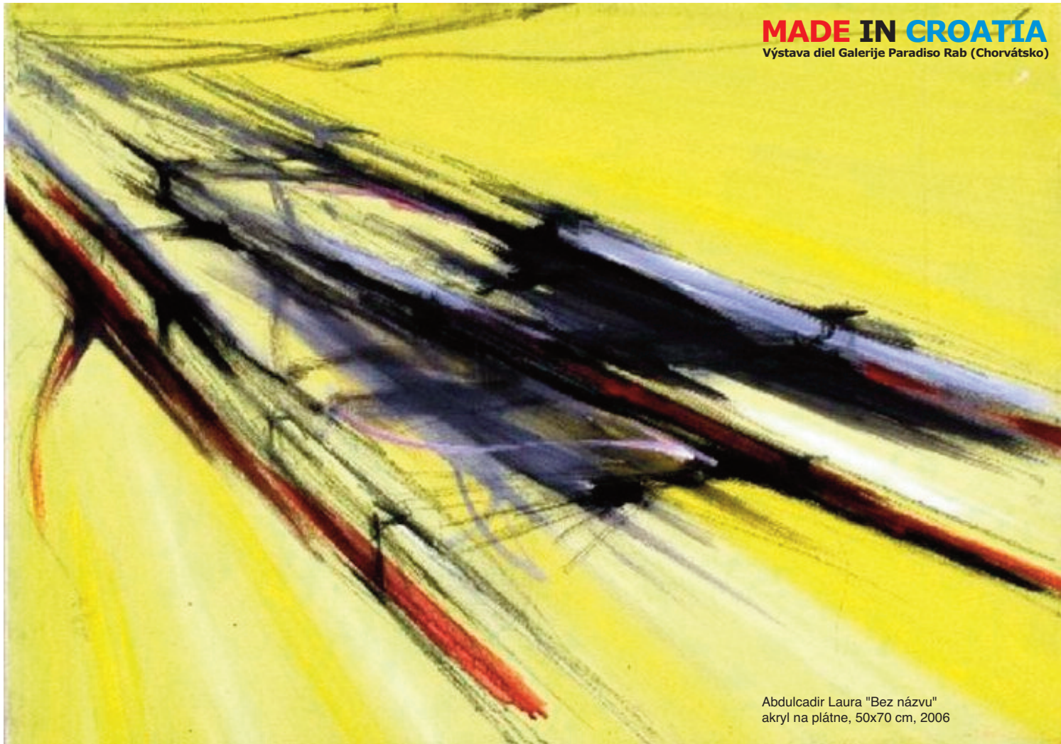
Abdulcadir Laura "Bez názvu" akryl na plátne, 50x70 cm, 2006

Výstava diel Galerije Paradiso Rab (Chorvátsko)