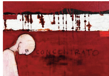
Garavini Tommaso "Concentrato" kombinovaná technika na plátne, 50x70 cm, 2006